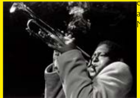
F ats Navaro