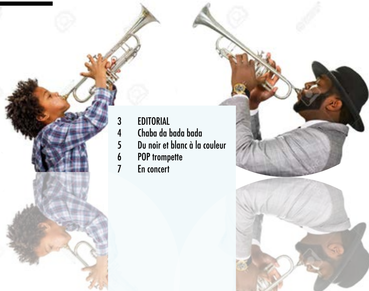
TABLE DES MA- TIÈRES